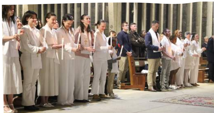
Les baptisés lors de la vigile pascalle, samedi 30 mars 2024, à l'église Saint-Liboire.