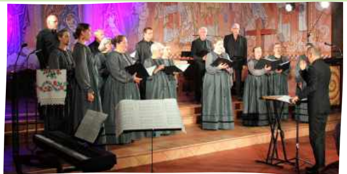
Une petite centaine de personnes sont venues à l'église Saint-Lazare pour le concert du "Nouveau Choeur" qui proposait des chants traditionnels ukrainiens, le jeudi 24 octobre 2024.