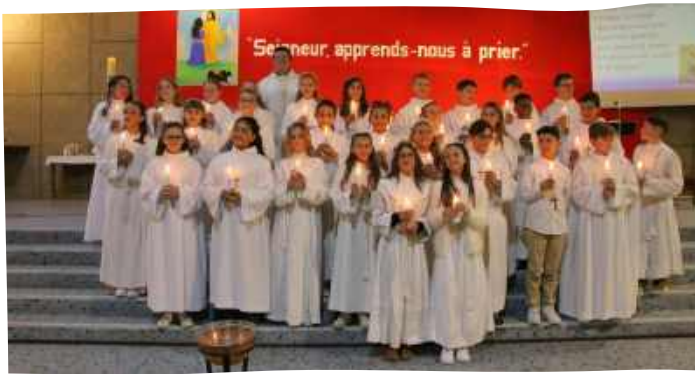
Professions de Foi du collège des Mûriers, le dimanche 17 novembre 2024 à Saint-Liboire.