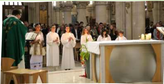
Professions de Foi des jeunes de l'Enseignement public, le dimanche 20 octobre 2024 à Saint-Pavin.